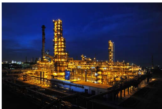
Омский НПЗ 27 мая 2010 года Успешно локализован пожар с применением пенообразователя ПО-6РП