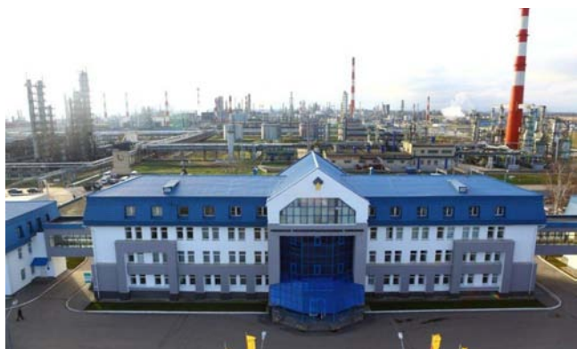
РНПК г. Рязань, «Роснефть» 12 февраля 2014 года Успешно локализован пожар с применением пенообразователя ПО-6РП