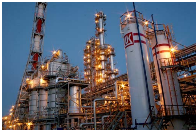
Лукойл-Волгограднефтепереработка 10 марта 2007 года Успешно потушен пожар с применением пенообразователя ПО-6РП